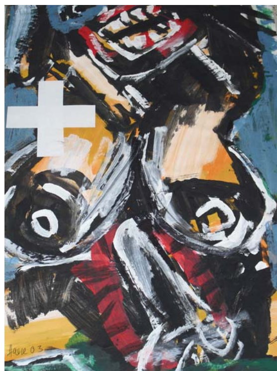
Figuration II, 2010, Dispersion auf Papier