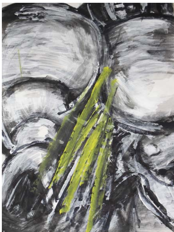
Figuration I, 2010, Dispersion auf Papier

1979 bis 2005 Zehnthaus Jockgrim, Produzentengalerie Karlsruhe, Villa Streccius, Landau, DAS Karlsruhe, Galerie für Atelier- und Bühnenkunst, Bad Dürkheim, Ezetera Galerie im Landesmuseum Mainz, Sparkasse Esslingen, Durlacher Kunsttage, Villa Böhm, Neustadt/Weinstraße, Ausstellung Daniel-Henry-Kahnweiler, Rockenhausen, Sparkasse Karlsruhe, Galerie Bernd Hummel – Neuffer am Park, Pirmasens, Sparkassenakademie des Landes Rheinland-Pfalz in Schloss Waldhausen bei Mainz, Galerie Camue, Mannheim, Staatskanzlei Mainz, Kunstverein Germersheim, Atelier Elke Mann, Karlsruhe, Galerie in der Mennonitenkirche Neuwied, Galerie Gawrisch, Zeiskam, The Beach Gallery, Miami, Kunstverein Bad Dürkheim, Orgelfabrik, Karlsruhe Durlach