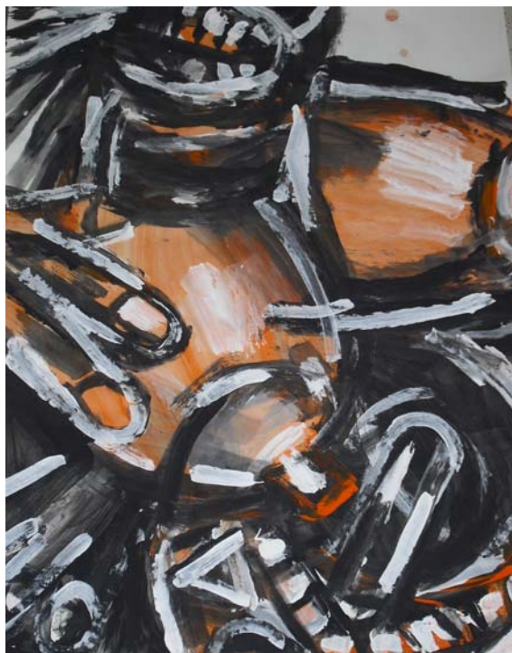
Figuration III, 2010, Dispersion auf Papier