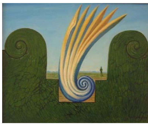
Arretierte Botschaft , 2007 , Öl auf Tafel 33 x 40 cm