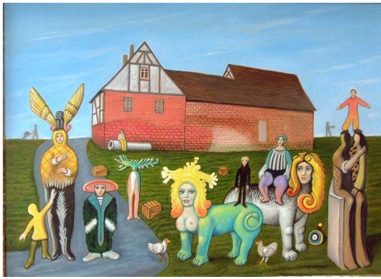
Abgelegenes Gehöft mit phant. Gruppe , 2006 Öl auf Tafel , 40 x 50 cm

Seit 1968 Mitglied der Arbeitsgemeinschaft Pfälzer Künstler, seit 1976 Mitglied der Pfälzischen Sezession; 1996 Vorstandsmitglied des „Zentrums der Phantastischen Künste e.V.“ Rolandseck