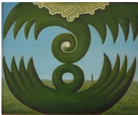
Das grüne Paradistor, 2007 , Öl auf Tafel 33 x 40 cm