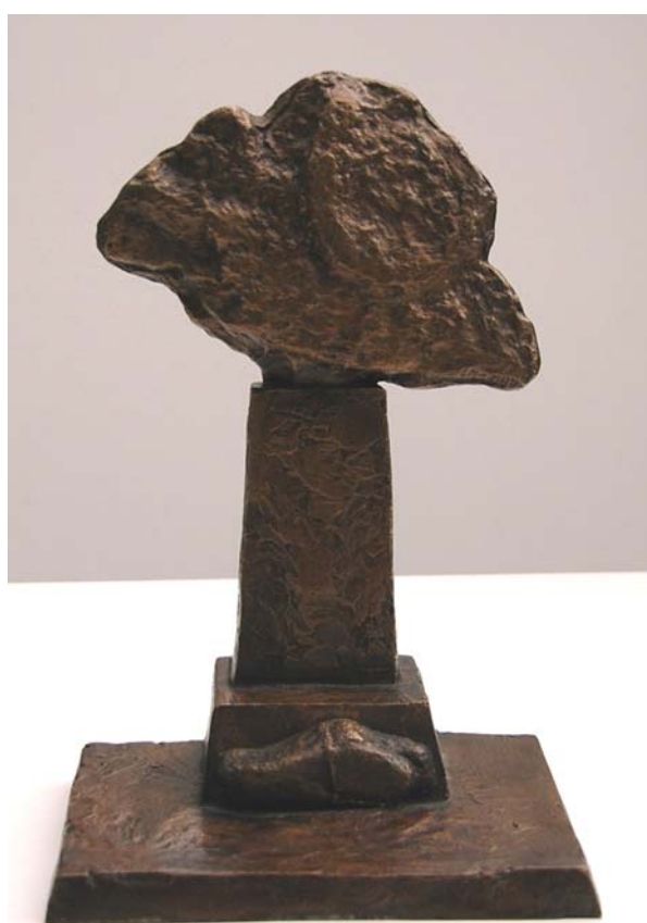
Wolke III, 2003, Bronze, 22 x 15 x 32 cm