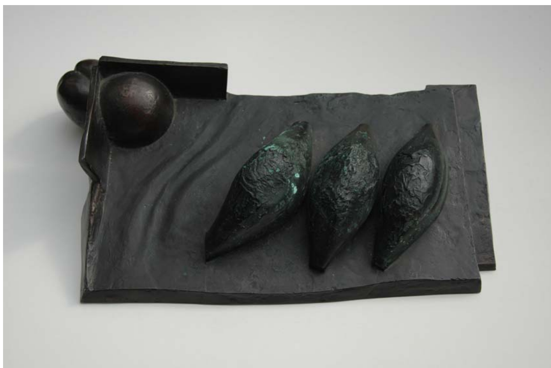
Schräger Tisch, 1981, Bronze, 46 x 27 cm