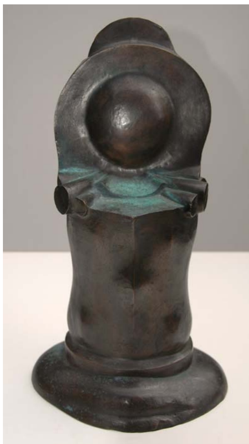
Säule, 1974, Bronze 22 x 45 cm

Regelmäßige Teilnahme an allen Ausstellungen der APK und der Pfälzischen Sezession in zahlreichen Städten in Rheinland-Pfalz, Kunstverein Neustadt/Wstr., Bildhauer des 20. Jahrhunderts Sindelfingen, Pfalzgalerie Kaiserslautern, Herrenhof Mußbach, Historisches Museum der Stadt Speyer, Schloß Mainau, Bad Neuenahr-Ahrweiler, Kunstverein Zweibrücken, Kreisgalerie Dahn, Kulturverein Wachenheim Werke in öffentlichen Sammlungen: NBK- Neuer Berliner Kunstverein, Berlin Landesmuseum Berlinische Galerie, Berlin, Zehnhaus Jockgrim, Pfalzgalerie Kaiserslautern, Landesmuseum, Mainz