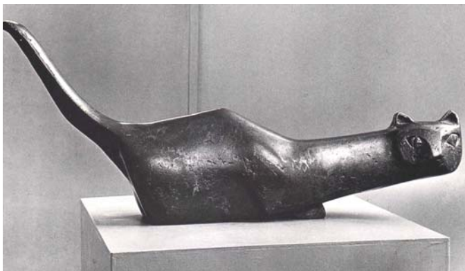
Katze, 1951, Bronze, L 35 cm

Stiftung Kurt Lehmann Münstertäler Str. 2 79219 Staufen i. Br. Tel. 07633-812-7777 kontakt@stiftung-kurt-lehmann.de