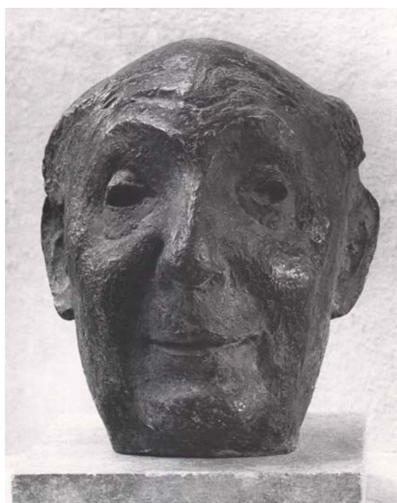
Portrait Max Tau, 1965, Bronze, H 26 cm