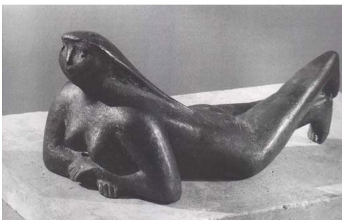
Liegende, 1955, Bronze, L 24 cm