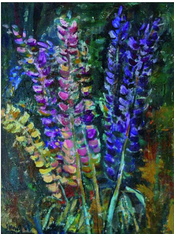
Rittersporn, 1968, Öl/Lw, 60 x 44 cm