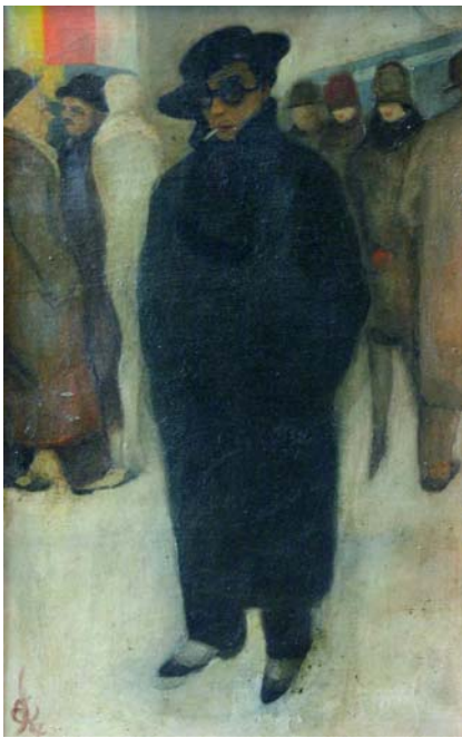
Selbstbildnis, 1927, Öl/Lw, 54 x 34 cm