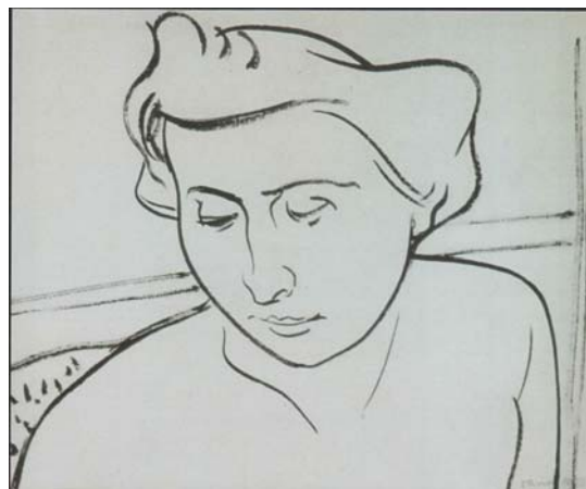
Bildnis Julia, 1953, Tusche, 28 x 34 cm