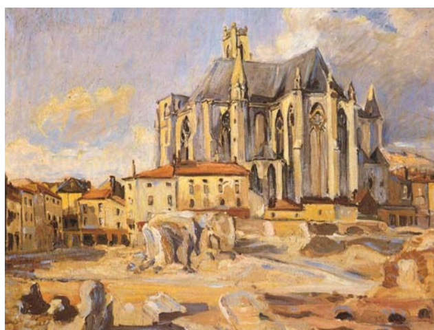
Kathedrale Toul, 1942, Öl/Lw., 52 x 69 cm

Otto-Ditscher-Galerie Ludwigshafener Str. 2 67141 Neuhofen/Pf. Tel. 06232-