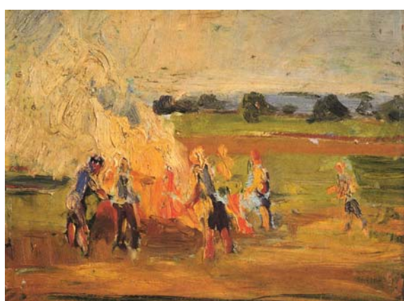
Kartoffelfeuer, 1949, Öl/Holz, 34 x 46 cm