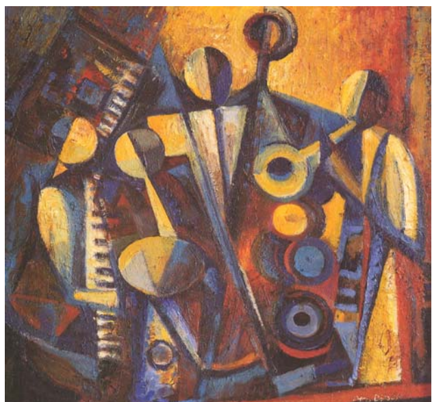
Jazz, 1984, Öl/Holz, 68 x 72 cm