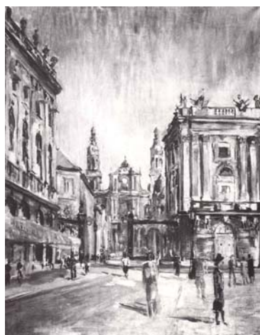
Nancy, 1941, Öl/Lw., 68 x 54 cm