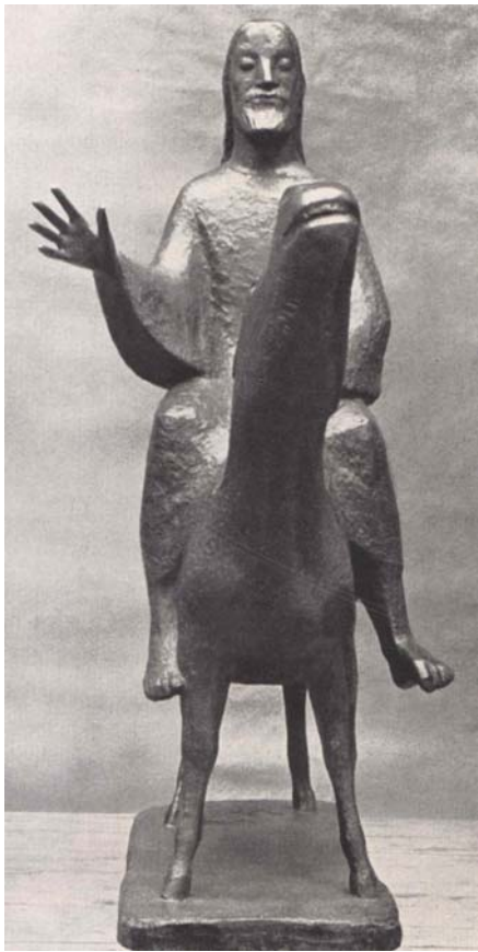
Palmesel, 1956, Bronze