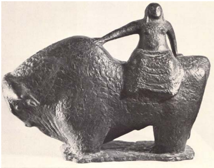
Europa, 1952, Eisenguß, 39 x 54 x 21 cm

Eine Nachlassverwaltung ist nicht bekannt