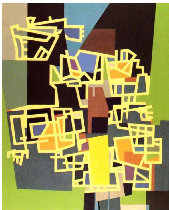
Gelbes Gitter, 1959, Öl/Hartfaser, 100 x 80 cm