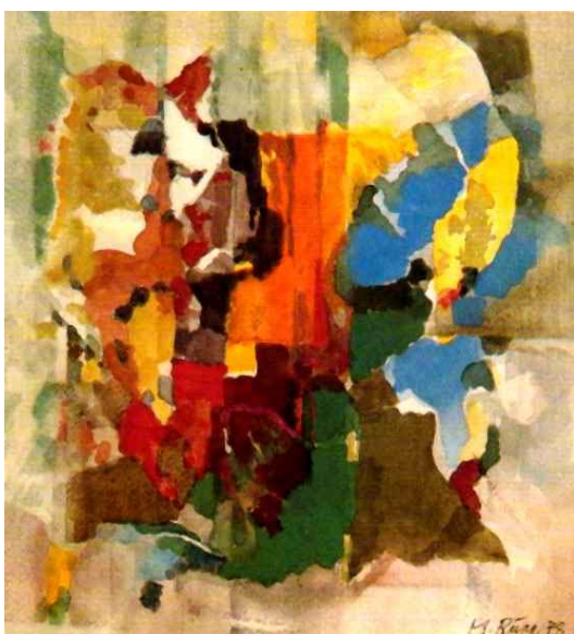
Impromptu, 1978, Deckfarben, 23 x 16 cm