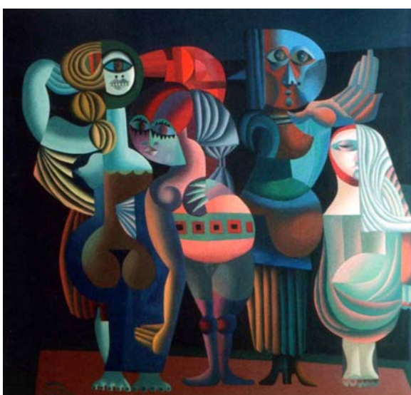
Soho/Die Schau, 1966/67, Öl/Lw., 119 x 140 cm