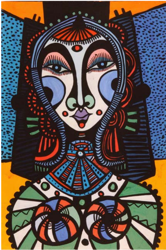
Tänzerin, 1957, Öl auf Pappe, 52 x 35 cm

Werner Scholzen Feldstr. 22 40721 Hilden Tel. 0171-9930102