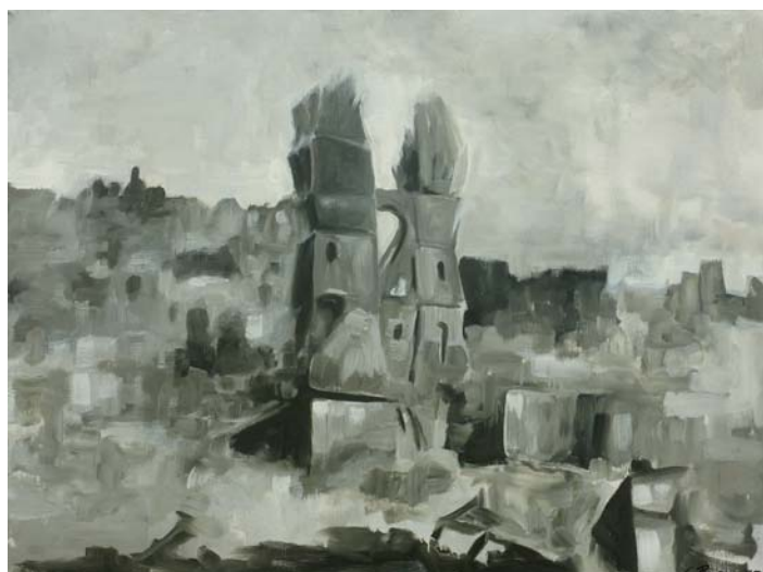
Pirmasens nach den Bombardements, Öl, 60 x 80 cm