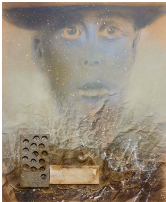
Fett und Filz, Mischtechnik, 65 x 75 cm

Mitglied in folgenden Künstlerverbänden Langjähriges Vorstandsmitglied, Arbeitsgemeinschaft Pfälzer Künstler; Mitglied der Pfälzischen Sezession