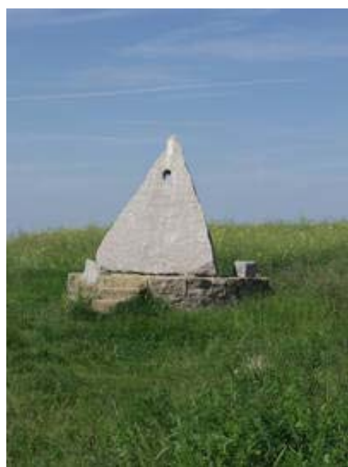
Der Drei gewidmet, 1987, Kalkstein, Dolomit, Granit, 300 x 300 x 300 cm