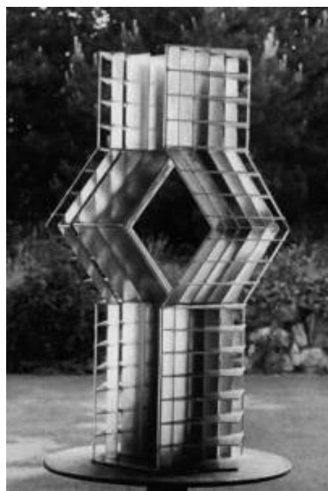
Verthori 30, kleine Fassung, 1972, Stahl 60 x 40 x 30 cm