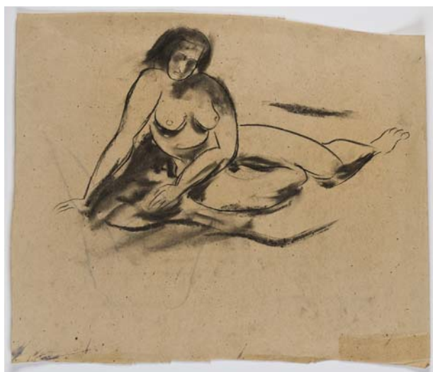
Studie I, 1949/50, Kohle