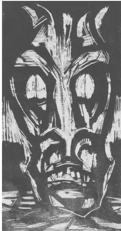
Tête animale, 1997, Holzschnitt 70 x 35 cm