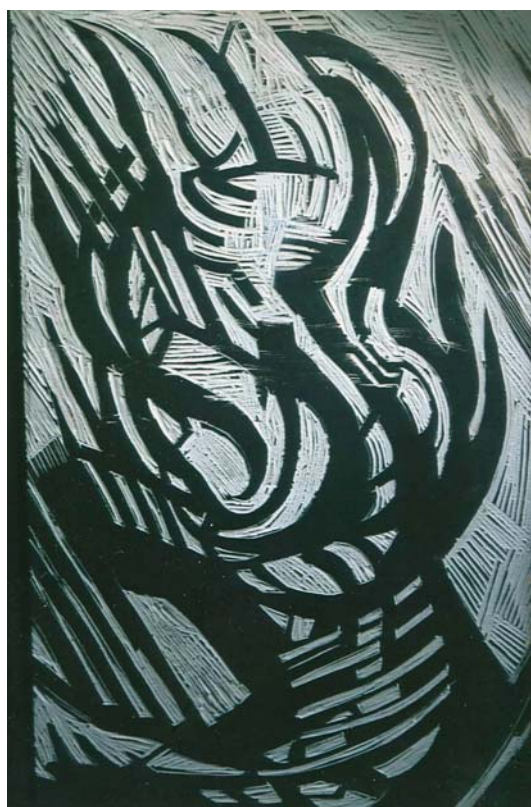
Sturm, 2007, Holztafel 100 x 60 cm