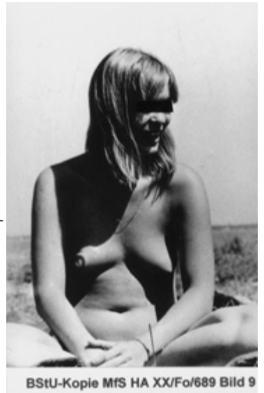
BStU-Kopie MfS HA XX/Fo/689 Bild 9

Motto und Thema der diesjährigen Fototage sind im Titel „Jetzt – Die erzählte Zeit“ formuliert. Zeit als zentraler Begriff der Fotografie beinhaltet sowohl den technischen Aspekt der Bilderzeugung als auch die inhaltliche Übertragung von Zeit in ein Bild. Durch Beobachtung und Interpretation wird das Zeitgeschehen erfasst und bildhaft festgehalten: Als authentischer, erzählter oder inszenierter Moment, oder als zeitlose, verdichtete epische Erzählung. Zeit ist ewig und – jetzt ist irgendwie immer!