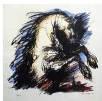
Nr. 12 Fischer, Hans (?), Aufsteigendes Pferd, aquarellierte Lithographie, 1946, signiert, datiert und bezeichnet, 25,0 x 26,5 cm, € 120,- / 60,-