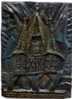
Nr. 17 Greiner, Baldur (1946), Michelstädter Rathaus, Bronzerelief, 1984, signiert und datiert, Expl. 470/900, 15,5 x 11,5 cm, € 120,- / 60,-