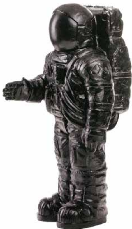
Nr. 22 Hörl, Ottmar (1950), Astronaut, schwarzer Kunststoff, 2017, signiert, datiert und bezeichnet als E.A., 55,0 x 25,0 x 32,0 cm, € 500,- / 380,-