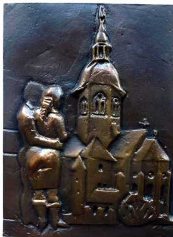
Nr. 36 Meise, Ralf (1958), Paar vor Einhardsbasilika in Seligenstadt, Bronzerelief, 1983, signiert und datiert, Expl. 470/900, 15,5 x 11,5 cm, € 120,- / 60,-