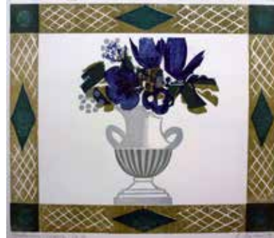
Nr. 14 Friedrich, Heinz (1924), Biedermeier-Sträußchen, Farbholzschnitt, 1979, signiert, datiert, betitelt und nummeriert, Expl. 26/30, 39,0 x 44,5 cm, € 100,- / 50,-