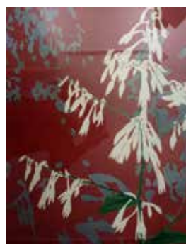
Nr. 61 van Vreden, Martin (1952), O.T., Blumen IV, Siebdruck, 1998, 65,0 x 50,0 cm, gerahmt, € 350,- / 150,-