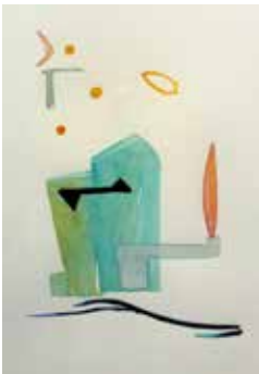
Nr. 48 Reuter, Peter (1955), O.T. (Abstraktes Haus mit Straßenlaterne), Aquarell, 1997, signiert und datiert, 46,0 x 35,0 cm, € 450,- / 90,-