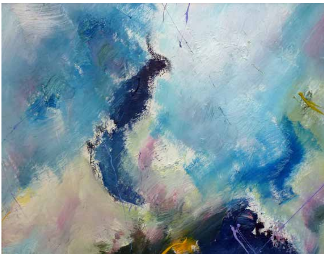
Nr. 4 Barber, Wilfried Georg (1941), Froh und heiter, Öl/Hartfaserplatte, 2011, signiert, 38,0 x 48,0 cm, gerahmt, € 560,- / 260,-