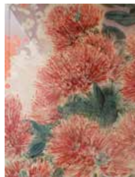
Nr. 59 van Vreden, Martin (1952), O.T., Blumen II, Siebdruck, 1998, 65,0 x 50,0 cm, gerahmt, € 350,- / 150,-