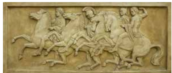
Nr. 57 Unbekannt, Römische Reiter, Relief, Gips, o.J., cm, € 80,- / 40,-