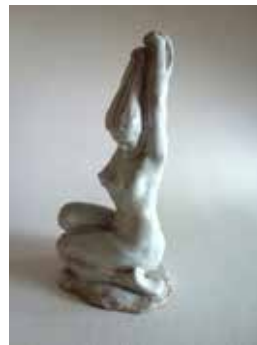
Nr. 29 L., H. (?), Weiblicher Akt, sich kämmend, Terrakotta, glasiert, 1954, monogrammiert HL und datiert, H 18,5 cm, € 480,- / 240,-€