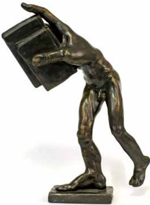
Nr. 54 Schwarze, Michael (1939), Buchhalter, Bronze, o.J., monogrammiert und nummeriert, Expl. 39/50, H. 25,0 cm, € 1.650,- / 800,-