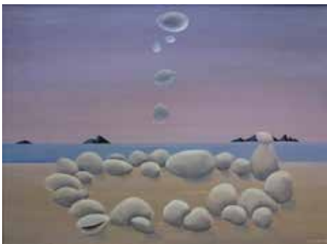
Nr. 49 Ruth-Soffner, Asta (1910-?), Der sardische Kreis, Öl/Lwd., 1976, signiert und datiert, 28,0 x 38,5 cm, gerahmt, € 380,- / 140,-