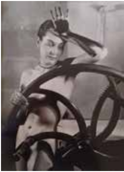
Nr. 46 Ray, Man (1890-1976), Erotique voilée, Meret Oppenheim à la presse chez Louis Marcoussis, 1933, Fotografie, Barytabzug, o.J., 40,4 x 30,5 cm, € 340,- / 220,-