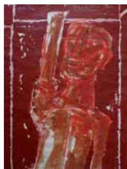
Nr. 23 Hagl, Rainer (1947), Figur im Raum (Versuch einen zu begraben, zu: Jean Améry), Mischtechnik, o.J., 63,0 x 48,5 cm, ohne Glas gerahmt, € 1.200,- / 450,-