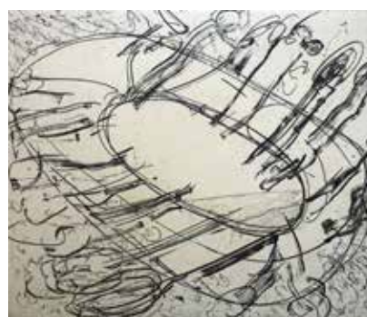
Nr. 8 Cragg, Tony (1949), Dinge, Ätzradierung, 1994, signiert, 20,5 x 24,5 cm, (Griffelkunst), € 280,- / 140,-