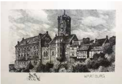
Nr. 56 Unbekannt, Wartburg (zum Lutherjahr!), Ätzradierung, o.J., 20,5 x 29,5 cm, € 20,- / 10,-