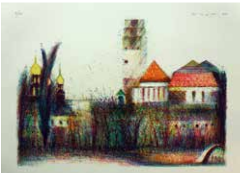
Nr. 27 Krüger, Rolf (1945), Darmstadt Mathildenhöhe, Farblithographie, 1994, signiert, datiert und bezeichnet, Expl. 7/50, 31,5 x 45,0 cm, € 180,- / 90,-