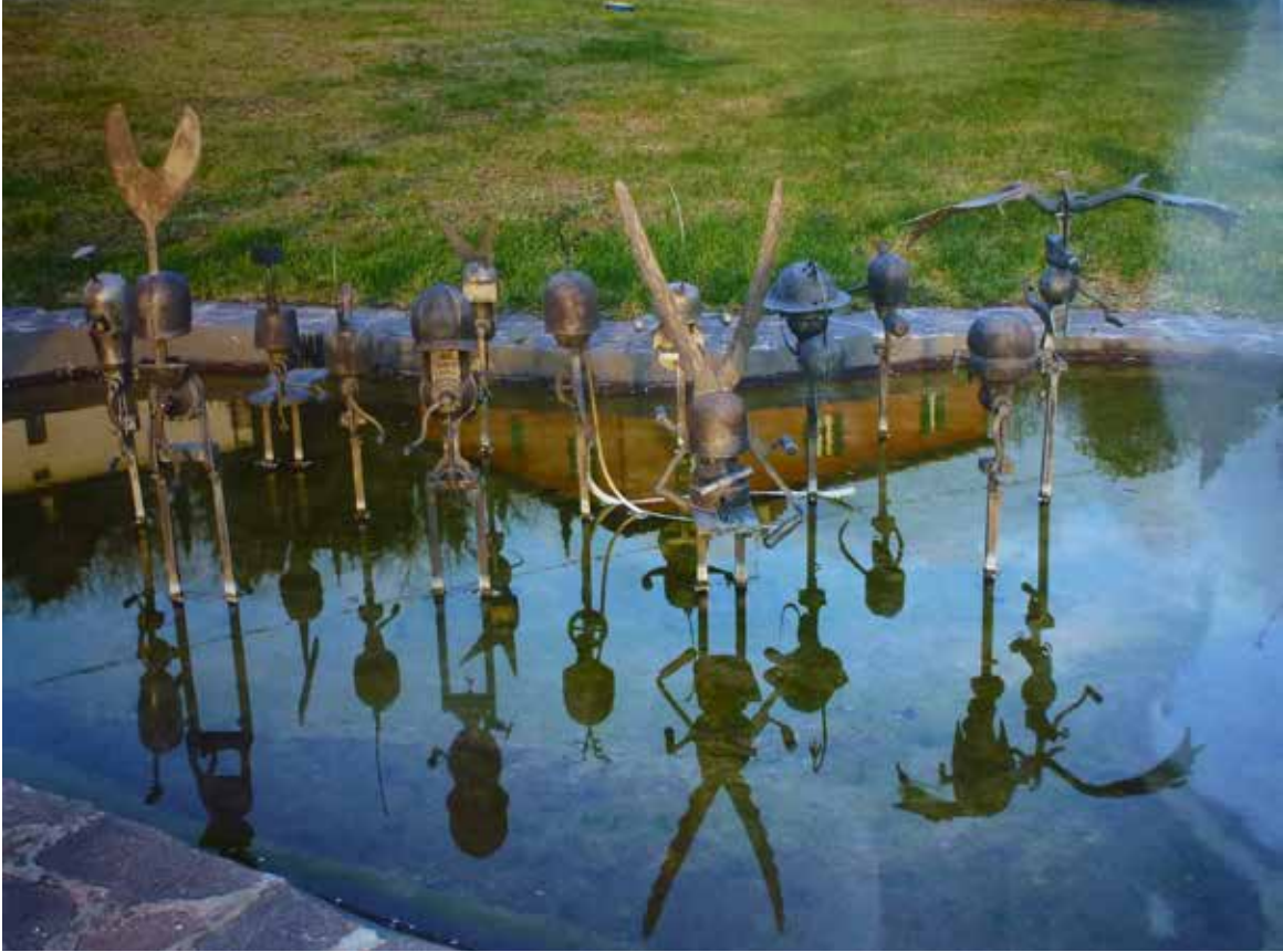
Nr. 39 Neumann, Susanne (1975), Krieger der Nacht (in Spoerris Garten), Fotografie, 1982, 50,0 x 70,0 cm, € 100,- / 50,-