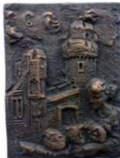
Nr. 2 Ausländer, Ariel (1964), Figurengruppe vor Auerbacher Schloss, Bronzerelief, 1990, signiert und datiert, Expl. 470/850, 14,5 x 11,0 cm, € 120,- / 60,-