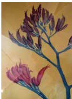
Nr. 58 van Vreden, Martin (1952), O.T., Blumen I, Siebdruck, 1998, 65,0 x 50,0 cm, gerahmt, € 350,- / 150,-