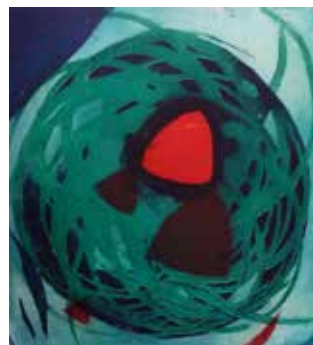
Nr. 20 Haas, Willibrord (1936), Die Farbe Rot, Farbradierung, 1996, signiert, datiert, betitelt und als E.A. bezeichnet 53,5 x 49,0 cm, Metallrahmen ohne Glas, € 380,- / 160,-