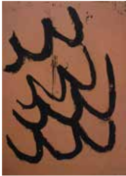
Nr. 13 Förg, Günther (1952), O.T., Farbradierung, 1993, 34,5 x 25,0 cm, (Griffelkunst), € 260,- / 150,-