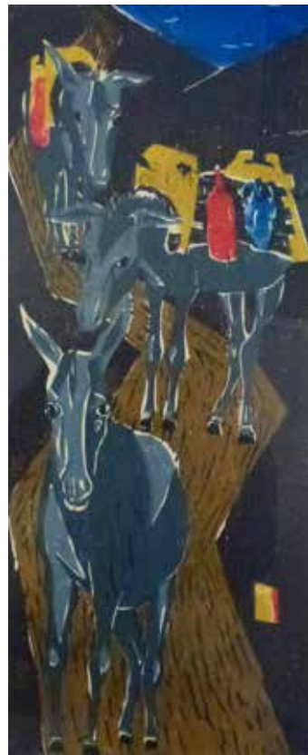
Nr. 50 Schlicker, Helmut, Griechischer Esel, Farblinolschnitt, 1962, signiert, datiert, betitelt und bezeichnet, Expl. 1/10, 42,5 x 17,5 cm, gerahmt, € 160,- / 80,-