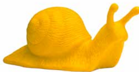
Nr. 21 Hörl, Ottmar (1950), Avantgarde-Schnecke, Soft-PVC, 2016, 6,0 x 5,0 x 13,0 cm, mit Signatur-Prägung, € 30,- / 15,-