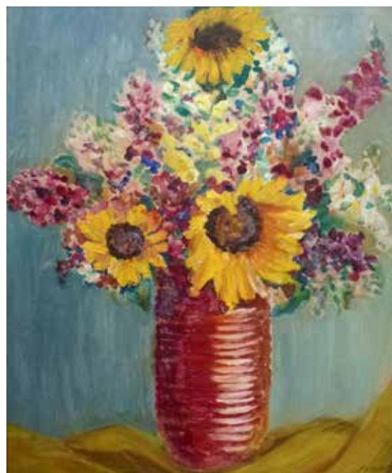
Nr. 28 Kühne, A. (?), Sonnenblumen in roter Vase, Öl/Malpappe, o.J., signiert, 48,0 x 39,0 cm, gerahmt, € 80,- / 40,-