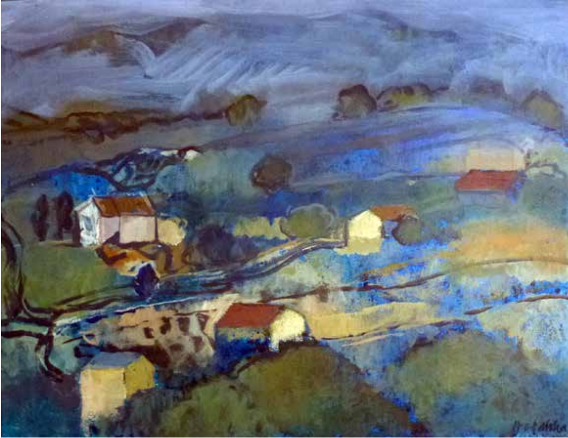
Nr. 25 Holowka, Malgorzata (1954), Landschaft blau (Mirabel), Acryl/Lwd., 1995, signiert, 60,0 x 46,0 cm, gerahmt, € 890,- / 320,-