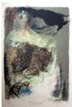
Nr. 26 Kröger, Pierre (1938), Teresa, Farblithographie, 1984, signiert, datiert und als E.A. bezeichnet, 36,0 x 24,0 cm, € 220,- / 120,-