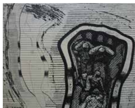
Nr. 38 Morgner, Michael (1942), Aufbruch, Aquatinta-Radierung, 1992, signiert, datiert und betitelt, (Griffelkunst), 24,5 x 31,5 cm, € 240,- / 120,-