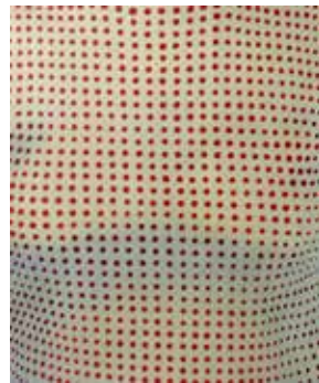
Nr. 55 Twelker, Jochen. (1957), Gänsehaut, 2000, Farblithographie, 58,5 x 49,5 cm, gerahmt, € 380,- / 180,-