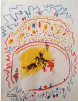
Nr. 44 Picasso, Pablo (1891-1973), La petite corrida (Stierkampfszene), Farblithographie, 23.11.1957, im Stein signiert und datiert, 31,0 x 24,0 cm, (WV Bloch 839), € 340,- / 180,-