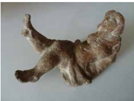
Nr. 30 Linke, Eberhard (1937), Wippe I (Liegender Akt), Terrakotta, 1974/75, monogrammiert und datiert, 11,5 x 21,0 x 11,0 cm, € 580,- / 350,-