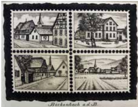
Nr. 15 Froese, Peter (1939), Briefmarkenentwurf mit vier Stadtansichten von Bickenbach, Ätzradierung, 1983, signiert, datiert und bezeichnet, Expl. 6/100, 8,0 x 11,0 cm, € 160,- / 60,-