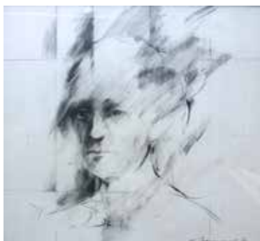
Nr. 3 Banaschewski, Roman (?), Kopf, Bleistift, 1979, signiert und datiert, 30,5 x 33,0 cm, gerahmt, € 380,- / 180,-