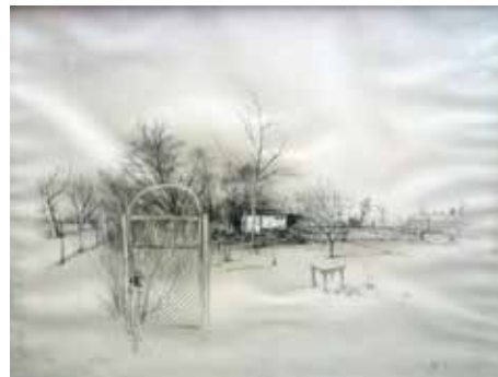
Nr. 18 Grüger, Ev (1928), Gartenhütte, Offset-Lithographie, 1983, signiert, datiert und betitelt, Expl. 41/100, 48,5 x 63,5 cm, gerahmt, € 180,- / 80,-