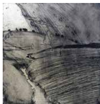
Nr. 63 Werkmeister, Wolfgang (1941), Regenlandschaft, Aquatinta-Radierung, o.J., signiert, betitelt und als E.A. bezeichnet, 14,0 x 13,5 cm, mit Metallrahmen gerahmt, € 140,- / 70,-