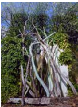
Nr. 40 Neumann, Susanne (1975), Mann im Geäst (in Spoerris Garten), o.J., Fotografie, 1982 70,0 x 50,0 cm, € 100,- / 50,-