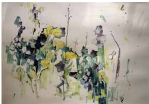
Nr. 24 Heinicke, Wolf (1929), Im Garten II, Aquarell, 1984, monogrammiert und datiert, 54,0 x 79,0 cm, mit Metallrahmen gerahmt, € 900,- / 450,-