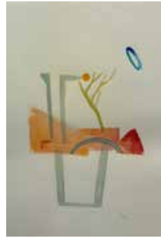
Nr. 47 Reuter, Peter (1955), O.T. (Abstrakte Landschaft mit Baum), Aquarell, 1997, signiert und datiert, 46,0 x 35,5 cm, gerahmt, € 450,- / 190,-