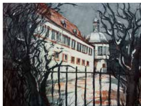
Nr. 10 Emrich, Reiner (1951), Kranichstein, Aquatinta-Radierung, 1993, monogrammiert, datiert und nummeriert, Expl. 12/100, 29,5 x 39,5 cm, € 120,- / 60,-