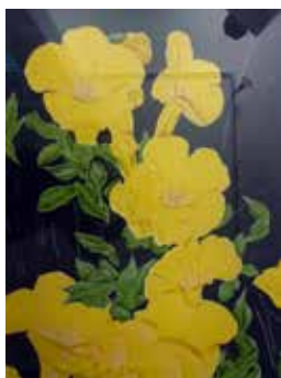
Nr. 60 van Vreden, Martin (1952), O.T., Blumen III, Siebdruck, 1998, 65,0 x 50,0 cm, gerahmt, € 350,- / 150,-