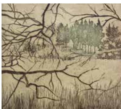
Nr. 64 Winter, Gerd (1951), Ried, farbige Ätzzradierung, 1979, signiert, datiert, betitelt und nummeriert, Expl. 18/30, 24,5 x 27,5 cm, gerahmt, € 180,- / 80,-