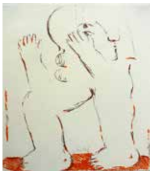
Nr. 1 Antes, Horst (1936), Kopffüßler, Offset-Farblithographie, 1966, signiert, 23,0 x 19,0 cm, € 250,- / 150,-